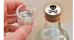
Этиловый спирт и суррогаты алкоголя за полгода убили 96 воронежцев

Равное распределение населения по полу является характерным трендом последних лет. Это свидетельствует о том, что в городе сохраняется гендерный баланс, который важен для устойчивого развития общества.