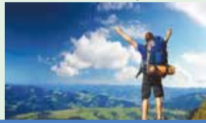
Продление программы туристического кешбэка

- ставить на окна фиксаторы, которые позволяют открыть на несколько сантиметров.