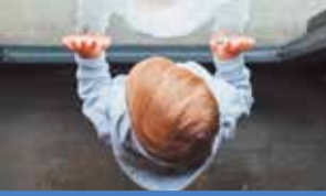
Осторожно: у окна ребёнок!

Воронежские врачи рассказали о 6 детях, выпавших из окон в Воронеже.