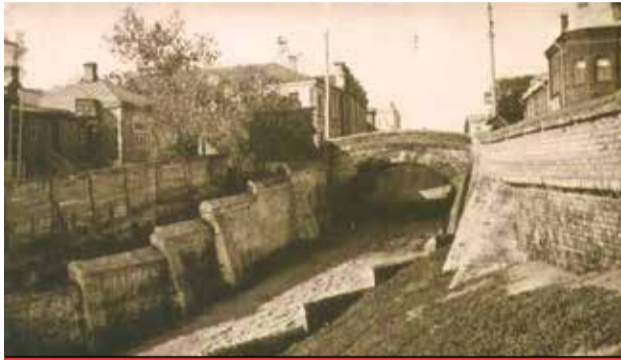
Каменный мост в начале XX века. (Арх. И.А.Блицын).

Первый июньский ливень затопил не только улицы Воронежа, но и фактически смыл одну из опор Каменного моста - старейшего воронежского моста. Весть о разрушении исторической воронежской достопримечательности моментально разлетелась по средствам массовой информации. Шутка ли, в 2026 году «каменный дедушка» отметит свой 200-летний юбилей. Сейчас рухнувшая опора Каменного моста ремонтируется. А мы решили рассказать о «воронежском долгожителе».