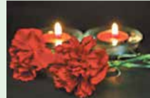
Воронежская область присоединится к акции «Свеча памяти»

- от 11% до 20% – с 18 июля 2023 года по 29 августа 2023 года.