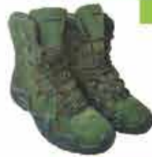
6500 р. Тактические ботинки ЛОКА