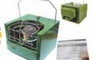
14000 р. Рюкзаки «БОБКА»-теплым сапо