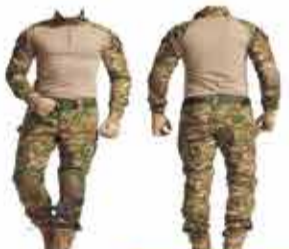
4700 р. Костюм тактический