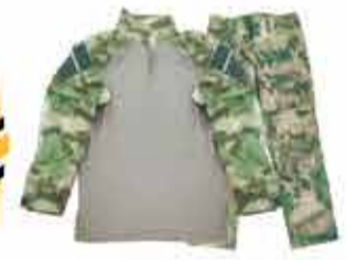
10500 р. Костюм боевой тактический