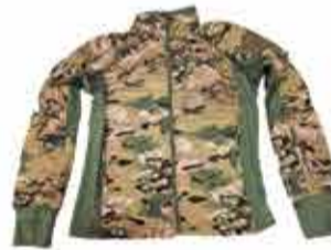
3800 р. Куртка тактическая ОБЛЕГЧЕННАЯ