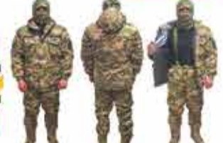
15400 р. Тактический костюм ЛЮБИМ При покупке военного оборудования обеспечиваемы скидки до 15%