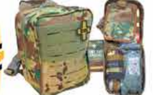
9500 р. Рюкзаки армейские