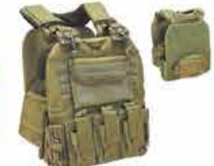
9800 р. Рюкзаки тактические