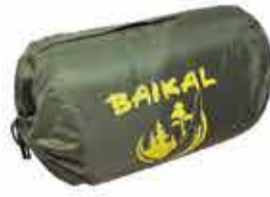
3500 р. Сумка зимняя «БАЙКАЛ»