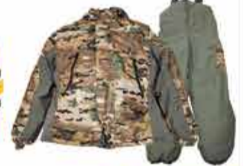
8500 р. Костюм «ГОРКА» зимний