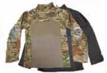
2600 р. Рубашка тактическая с длинным рукавом