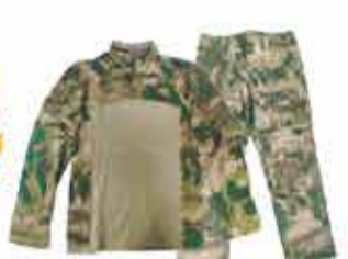
4930 р. Костюм горной тактической «БОБКА»