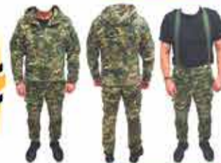
3900 р. Костюм ФОРСАЖЕ