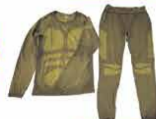
2100 р. Тренировка