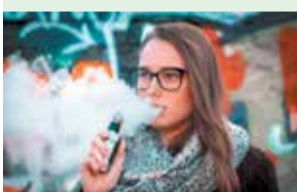
Вейпы детям запрещены

С 9 мая вступает в силу запрет на продажу вейпов детям.