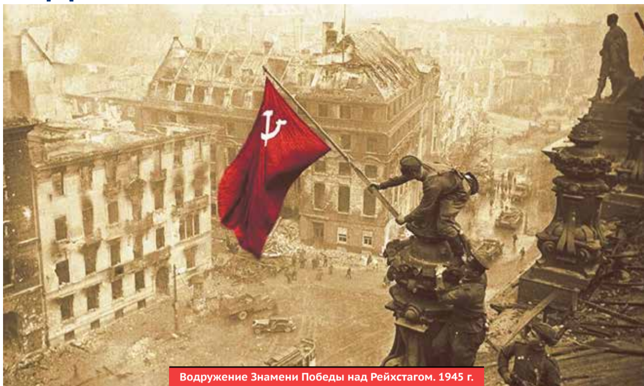
Водружение Знамени Победы над Рейхстагом. 1945 г.

Повсюду прошли народные гулянья, многолюдные митинги. В парках и на пло-