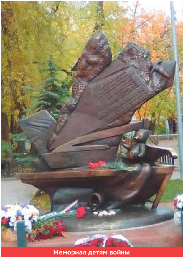
Мемориал детям войны