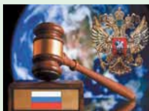
Лишить свободы пожизненно за госизмену

альных сетях, отныне такая демонстрация также запрещена.