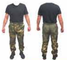
980 р. БРОНИ ВЛ-ФЛОНТ

НОВОГОДНИЕ ЦЕНЫ ДЕЙСТВУЮТ ДО КОНЦА ЯНВАРЯ. УСПЕЙТЕ ПРИОБРЕСТИ