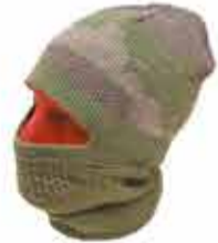
900 р. ШАПКА-КАЛЬЦАЛА