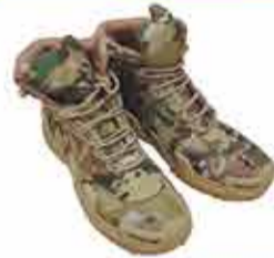
6500 р. ТАКТИЧЕСКИЕ БОТТИНКИ ЛОКА