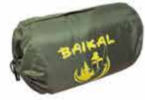
3500 р. СУВЯЩИЙ СЕБЕОБ 'БАЙКАЛ'