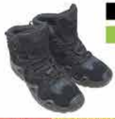
4700 р. ТАКТИЧЕСКИЕ БОТТИНКИ ЛОКА