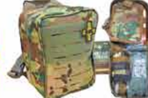
9500 р. АРМОНКА АРМИКАР