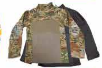
2600 р. РЕМЕНЬ ТАКТИЧЕСКИЙ С ДИВЕРСИОННЫМИ

НОВОГОДНИЕ ЦЕНЫ ДЕЙСТВУЮТ ДО КОНЦА ЯНВАРЯ. УСПЕЙТЕ ПРИОБРЕСТИ