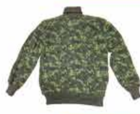
от 1300 р. СВИТЕР