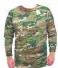
1100 р. ФУТБАЛКА УТЕПЛЕННАЯ