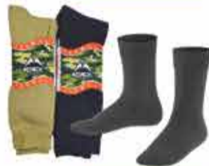
450 р. ТРИКОТИЖ