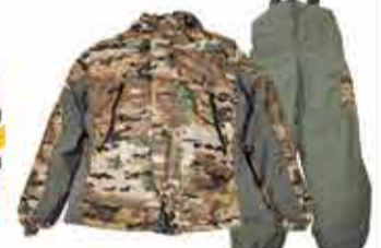
8500 р. КОСТЮМ 'ГОРКА' ЛЮБОВА