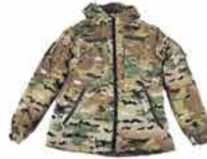
от 6300 р. КУРТКА ЛЮБОВА