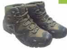
6000 р. ТАКТИЧЕСКИЕ БОТТИНКИ ЛОКА