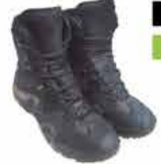
8500 р. ТАКТИЧЕСКИЕ БОТТИНКИ АТЛАС