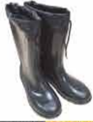
от 1000 р. Сапоги резиновые БЕММ