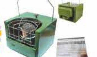
14000 р. ПРИБОР ОБИГРЕВА-ТЕПЛОМЫ САРКО