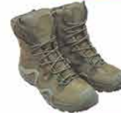
8500 р. ТАКТИЧЕСКИЕ БОТТИНКИ АТЛАС