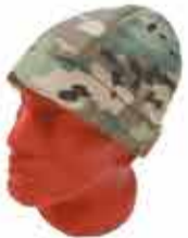
от 350 р. ШАПКА (СУБЛИМАЦИЯ)