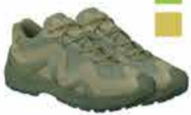
6460 р. ТАКТИЧЕСКИЕ БОТТИНКИ ВОГЕЛ