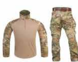
5200 р. КОСТЮМ БОЕВОЙ ТАКТИЧЕСКИЙ