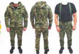
3900 р. КОСТЮМ ОДИНОВЫЙ