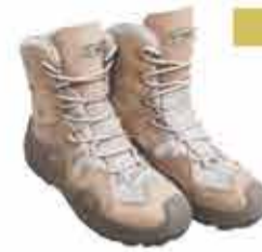
8500 р. ТАКТИЧЕСКИЕ БОТТИНКИ ВОГЕЛ