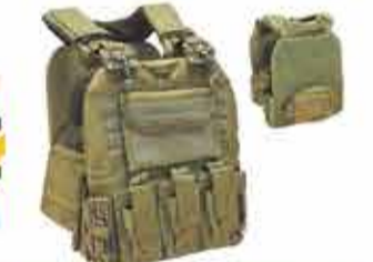
9800 р. РЕМЕНЬ ТАКТИЧЕСКИЙ