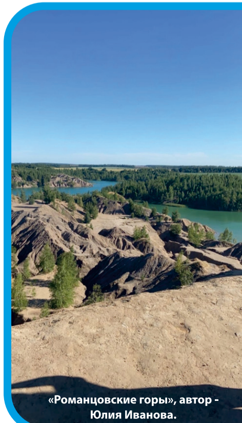
«Романцовские горы», автор - Юлия Иванова.