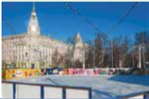
С площади Ленина в Воронеже уберут бесплатный каток

Во время работ планируется обновить конструкции здания, что позволит выполнить современные требования по пожарной безопасности и содержанию животных. Также планируется заменить техническое оборудование, что сделает представления цирка более зрелищными и современными.