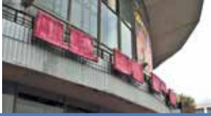
Воронежский цирк закроют на реконструкцию в 2023 году